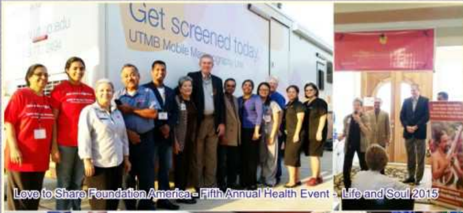
Love to Share Foundation America - Fifth Annual Health Event - Life and Soul 2015