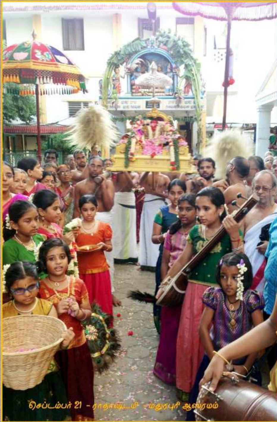
செப்டம்பர் 21 - ராதாஸ்டமி - மதுரபுரி ஆஸரமம்