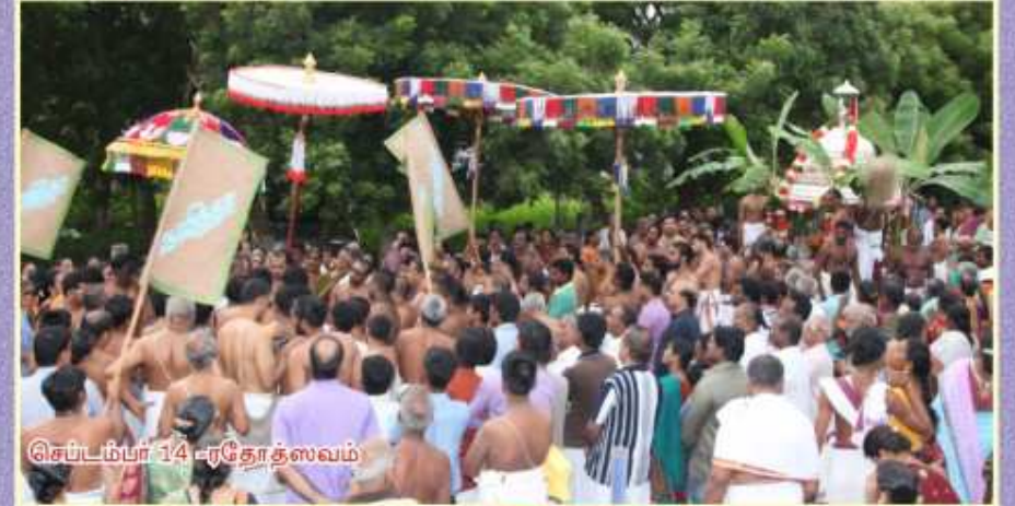
செப்டம்பர் 14 - ரதோத்ஸவம்