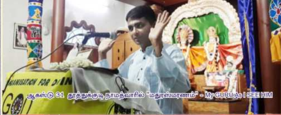
ஆகஸ்டு 31 தூத்துக்குடி நாமத்வாரில் "மதுரஸ்மரணம்" - My GURU AS I SEE HIM