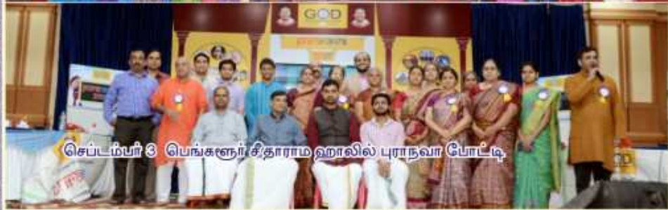
செப்டம்பர் 3 பெங்களூர் சிதாராம ஹாலில் புராநவா போட்டி