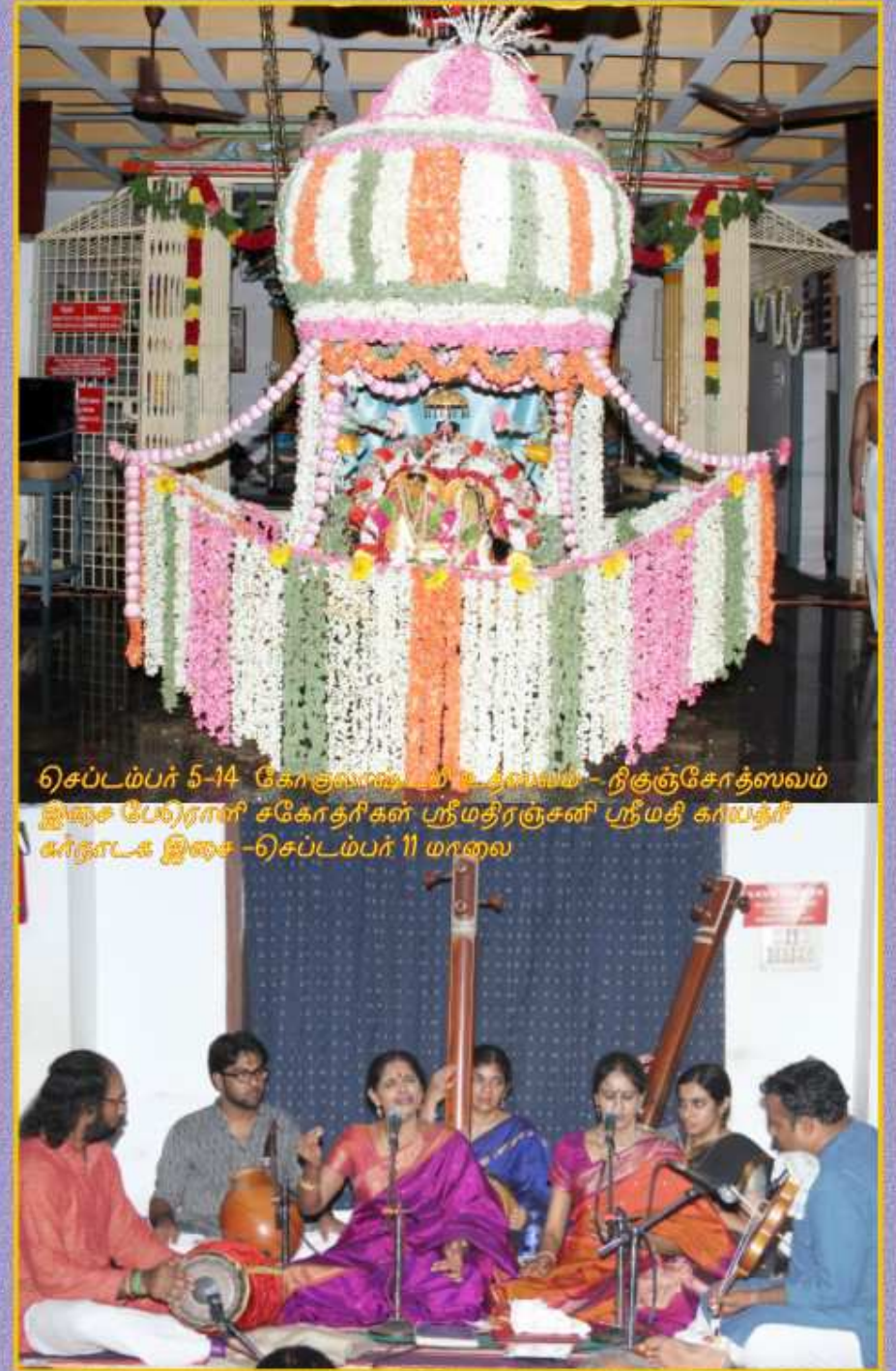
செப்டம்பர் 5-14 கோகுலாஷ்டமி உதஸவம் - நிகஞ்சோதஸவம் ஐஐஐசே பேரிராணி சகோதரிகள் ப்ரீமதிருசனி ப்ரீமதி கர்யதரீ கர்நாடக ஐஐஐசே - செப்டம்பர் 11 மாஸா