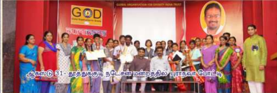
ஆகஸ்டு 31- தூத்துக்குடி நட்சன்மன்றத்தில் புராநவா போட்டி