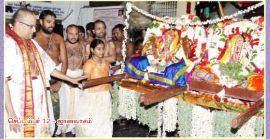
செப்டம்பர் 12 - ஜானவாசம்